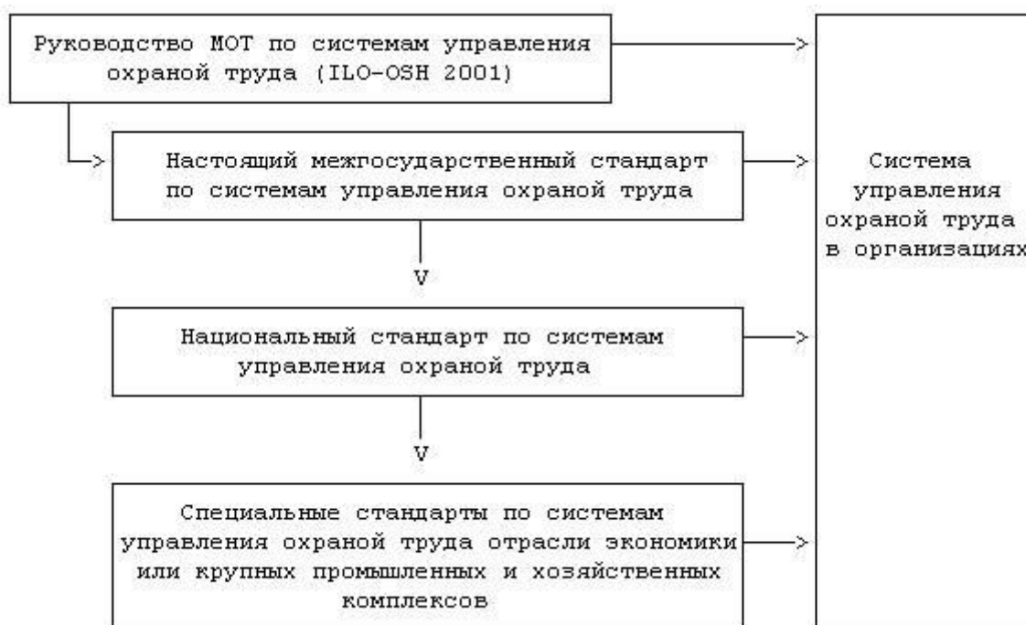
Рисунок 1. Элементы национальных структур систем управления охраной труда

3.3.2. Элементы национальных структур управления охраной труда и связи между ними представлены на рисунке 1.